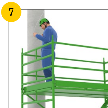
Wir verwenden tragbare Leitern nur, wenn es keine sichere Alternative gibt. Wir sichern Leitern gegen Wegrutschen und Umkippen.