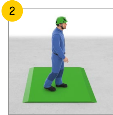
Wir sichern alle Bodenöffnungen und nicht durchbruchsfähigen Bauteile.