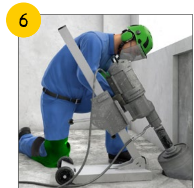
Wir benutzen immer die geeigneten, erforderlichen persönlichen Schutzausrüstungen.