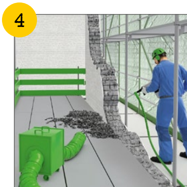
Wir benutzen nur sichere und freigegebene Gerüste.