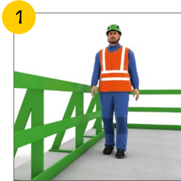
Wir sichern Absturzkanten.