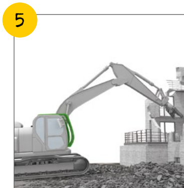
Wir halten uns außerhalb des Gefahrenbereichs von Abbruchmaschinen auf.