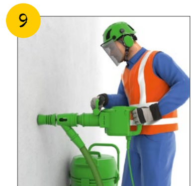
Wir arbeiten staubarm und benutzen Maschinen mit Absaugung.

Die lebenswichtigen Regeln gibt es auch digital. ▶