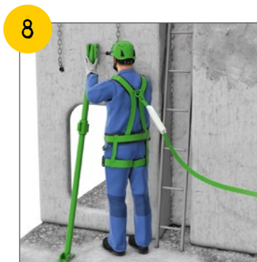
Wir sichern Bauteile und Lasten gegen Umstürzen und Herabfallen. Wir meiden Gefahrenbereiche von Lasten.